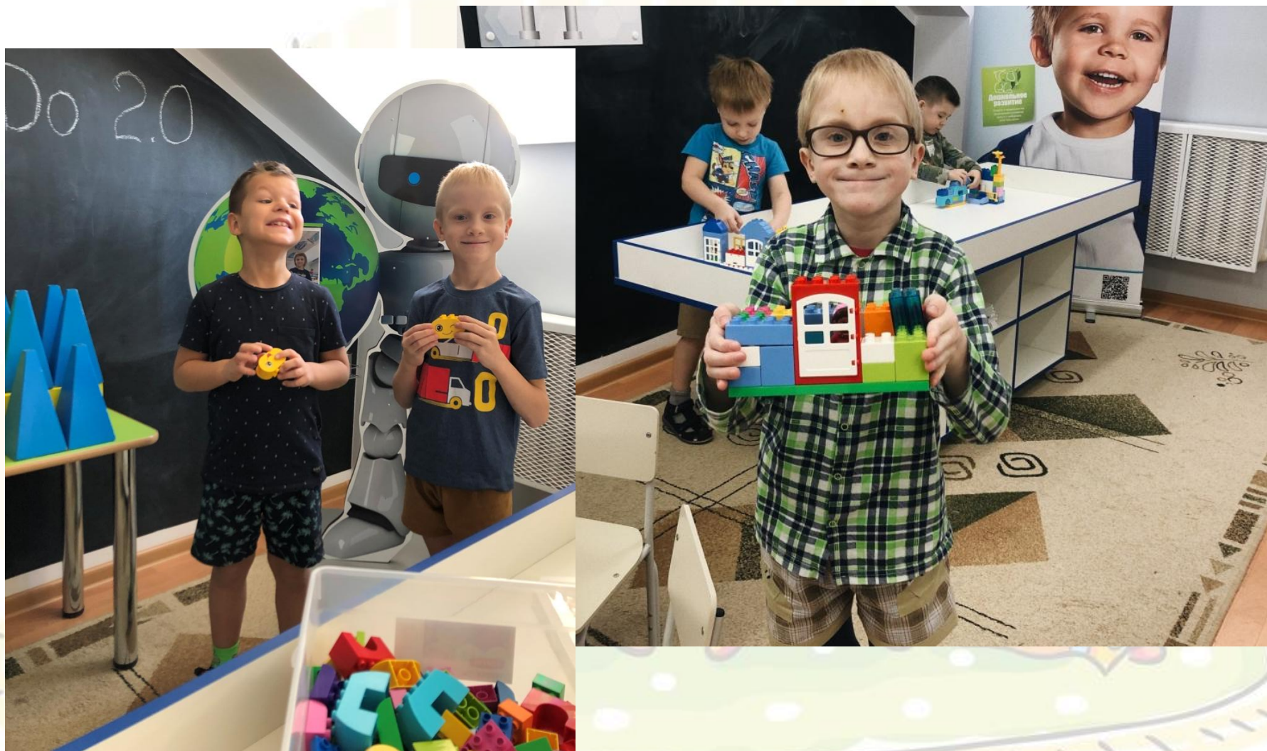
Занятия по LEGO - конструированию