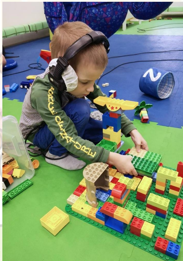
Работа по методу «Tomatis»