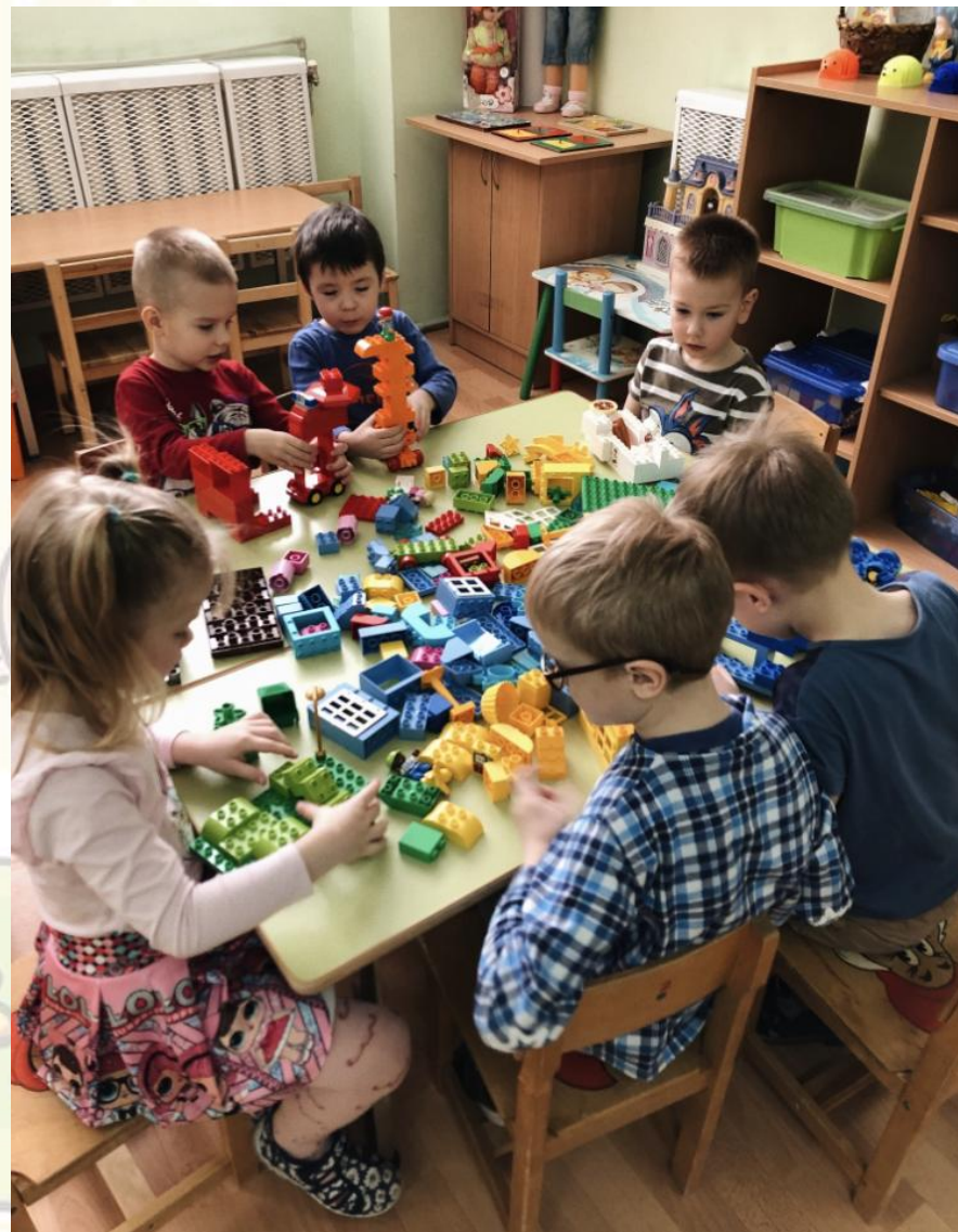
Занятия по LEGO - конструированию