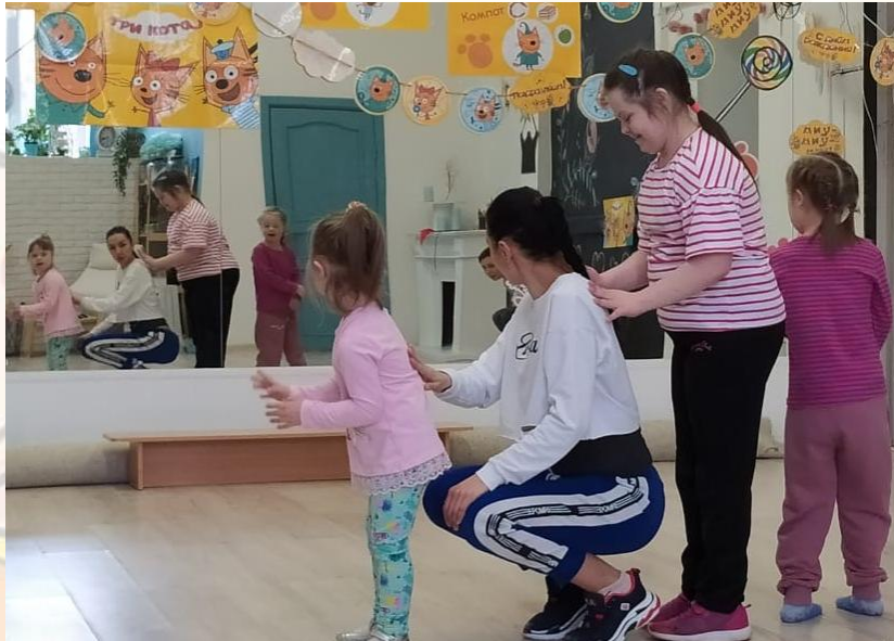
Занятие танцами в спец. группе