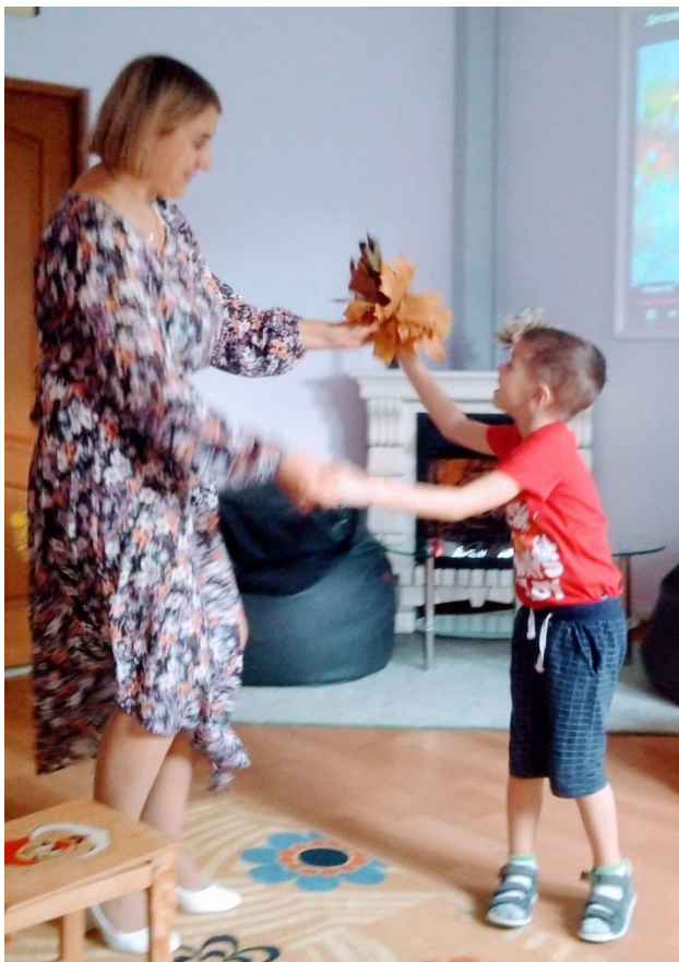
Занятие с дефектологом